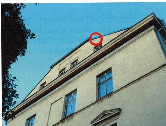
č. 2 Zákresy hnízdišť rorýse obecného, severozápadní štít